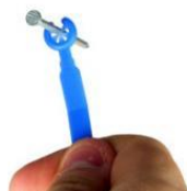
- podložka na klince