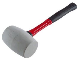
- kladivo gumené