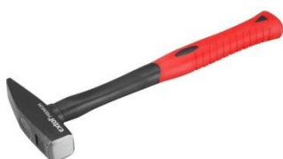
- kladivo na zatĺkanie klincov + klince