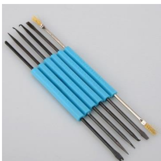
- 6 dielna sada čistiacich nástrojov na plošné spoje

Náhľad komponentov, z ktorých súprava pozostáva: