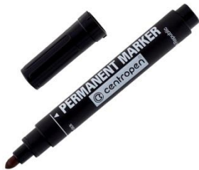
- centro fixka 5 mm