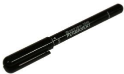
- centro fixka 2 mm

- chlorid železitý v plastovej 1l. fľaši