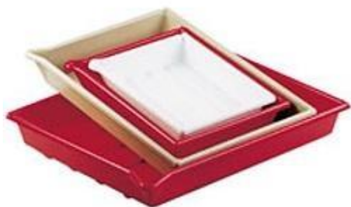
- plastová miska fotografická (biela)