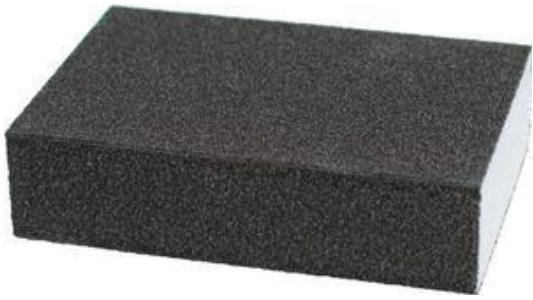
- hubka brúsna 4 stranná