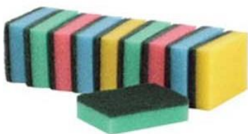
- hubka na riad