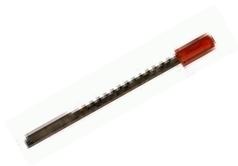
- náhradné lupienkové píly