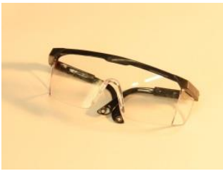
- ochranné okuliare