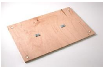
- základová doska s háčikmi na uchytenie