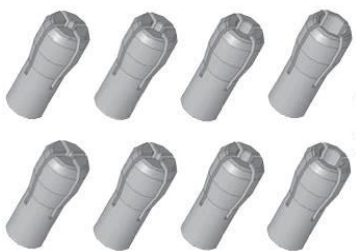
- kovové upínacie klieštiny