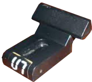
- podstavec pod dlátko