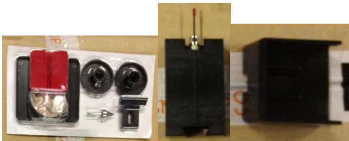
- lupienková píla + ručná brúska