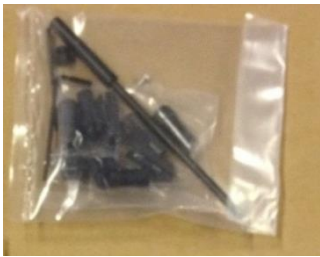
- klieštiny a dlátko