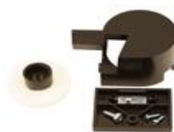
- nástrojová brúska s brúsnym