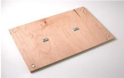
- základová doska s háčikmi na uchytenie